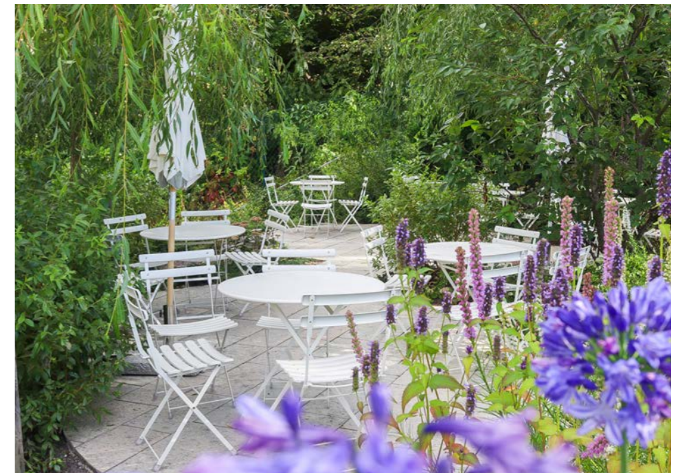
→ I Skanshofparken är växterna utvalda för att ge en känsla av medelhavet med blommor som blommar i blått och lila. Träd och buskar formar små rum i parken.