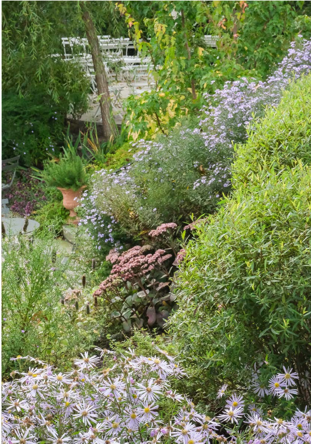
↑ En väl komponerad blandning av buskar, perenner och lökväxter gynnar den biologiska mångfalden och ger ett prydnadsvärde från tidig vår till sen höst. Under hösten blommar astrar och kärleksört.